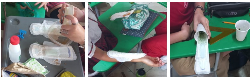
Figura N° 1. Experiencia de aula utilizando la toalla higiénica para la separación cromatográfica.

El objetivo de la experiencia cromatográfica era plantear una estrategia que permitiera separar el extracto de zanahoria y espinaca utilizando como superficie cromatográfica una toalla higiénica y de solvente alcohol y agua. Al final, los estudiantes debían medir el corrimiento de las muestras e indagar acerca de la variación de color en las muestras, con lo cual, se establece el desarrollo de las habilidades de pensamiento científico para el éxito de la experiencia de aula.