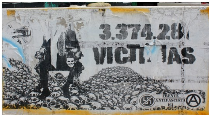
Figura 3 Stencil 15

Nota. Esta imagen digital representa un stencil ubicado en la zona de acceso del edificio Central de la UPTC, por Navarrete (2021).