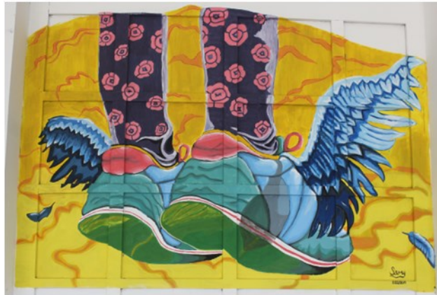
Figura 2 4. Zapatos con alas. Samantha Villamarin.

Nota. Esta imagen digital representa un mural ubicado en la fachada exterior central del edificio Central de la UPTC Navarrete (2021).