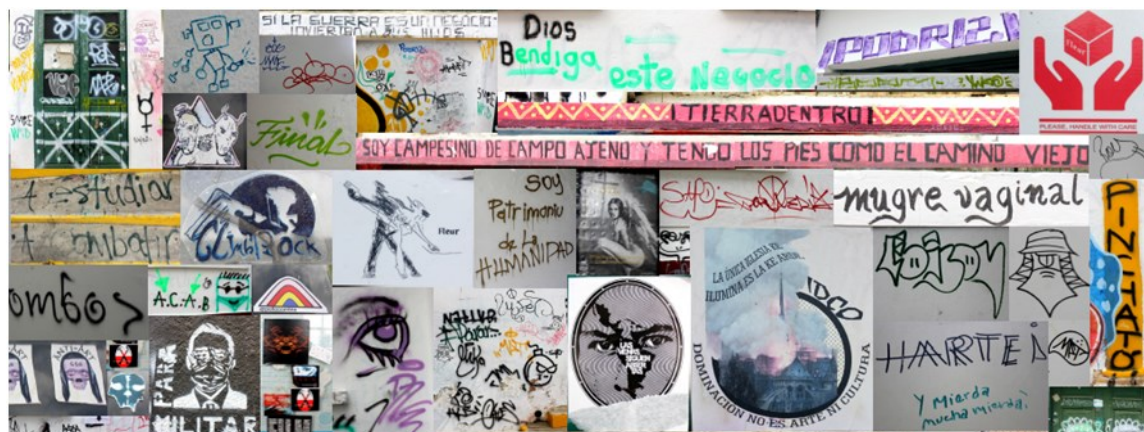
Figura 1 Collage de firmas y líneas

Nota. Esta imagen digital representa las firmas y líneas de murales ubicados tanto en la parte exterior como en el interior del edificio Central de la UPTC, Navarrete (2021).