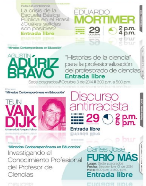
La crisis de la escuela básica pública en el Brasil: ¿Cuáles salidas son posibles?

Este énfasis busca apoyar el desarrollo profesional a nivel de doctorado abordando de manera específica las temáticas relacionadas con la enseñanza-aprendizaje del idioma inglés, contribuyendo a una construcción de conocimiento que proporcione condiciones adecuadas para la investigación en un mundo globalizado.